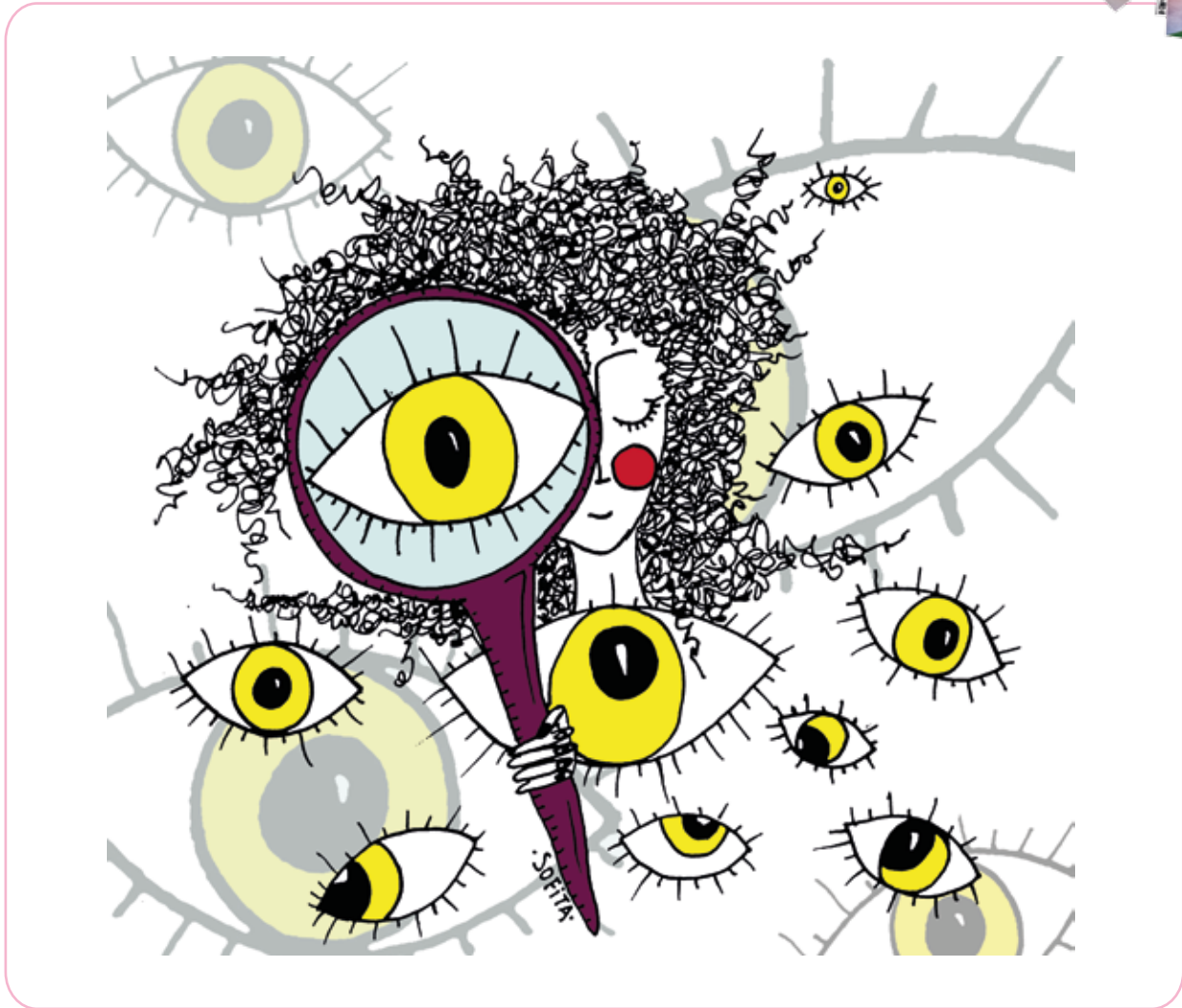
Ilustración: Sofía Belén Biroccio

Si te propongo hacer una excursión hacia lo invisible en tu propia casa: ¿en qué pensás? ¿En buscar con una lupa cosas muy muy chiquitas, que no ves a simple vista? ¿En recorrer el aire o alguna cosa transparente? Qué intriga. Bueno... empecemos la excursión y veamos a dónde nos lleva.